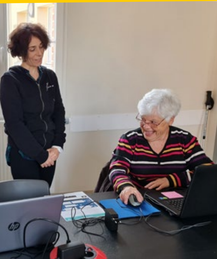
dispense lors des ateliers numériques, comme ici à Valescourt.